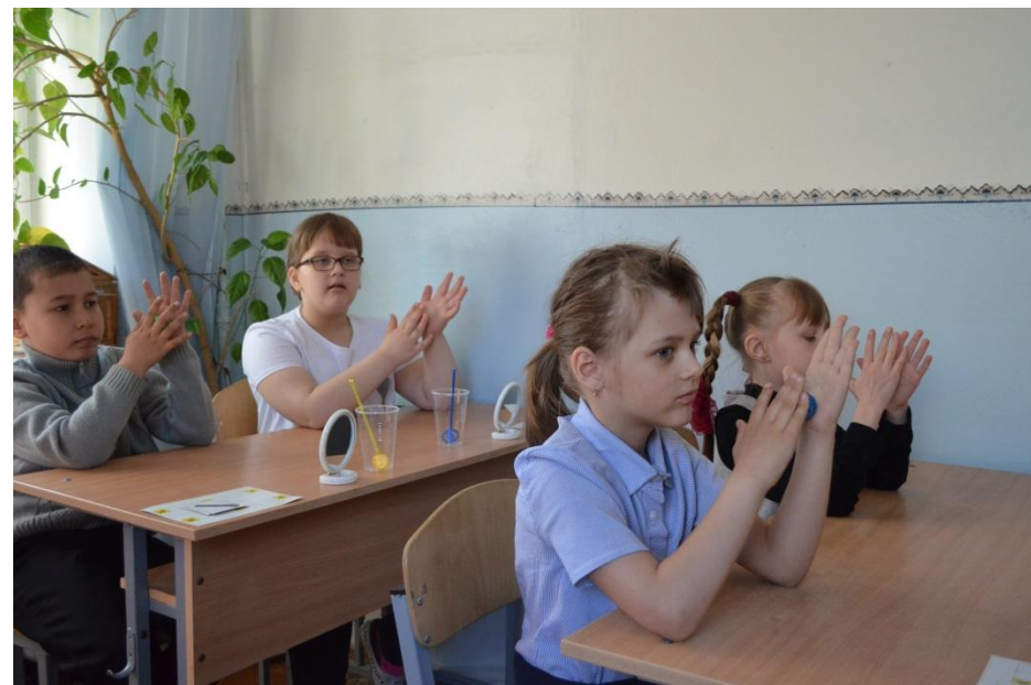
Совершенствование мелкой моторики шариками Су-джок