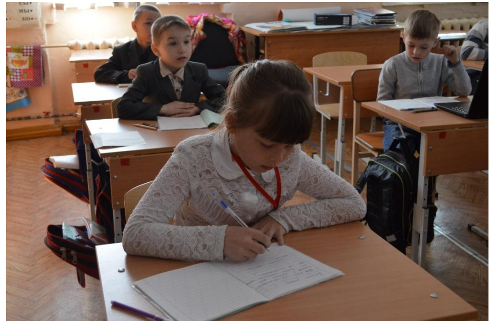
Обновлённое удобное рабочее место