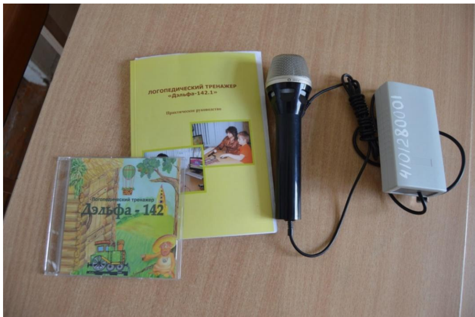
Логопедический тренажёр «Дельфа»