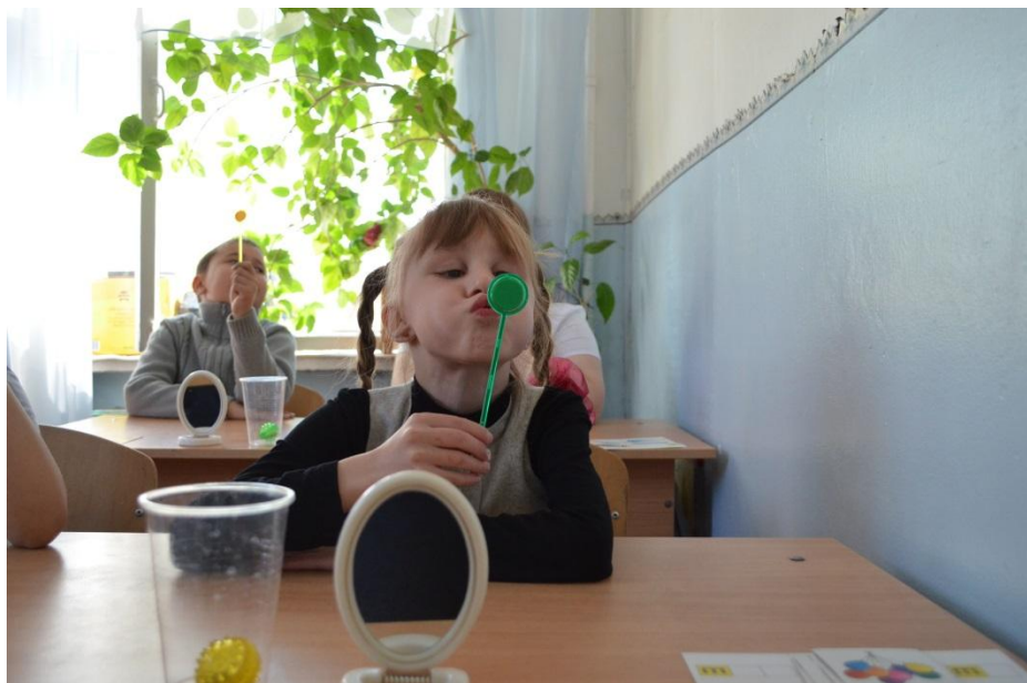
Дыхательная гимнастика с использованием тренажёров