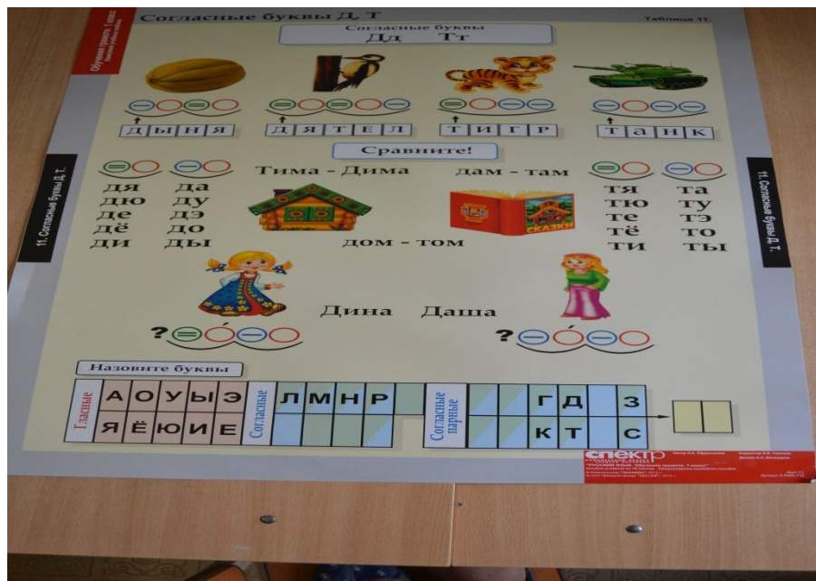
Плакаты на дифференциацию согласных