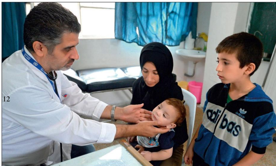
Истинный ислам призывает к состраданию и милосердию. Врач осматривает ребенка в медицинском пункте лагеря при одной из школ Дамаска.

Радикалы объявляют «врагами ислама» всех несогласных с ними мусульман. Ультрарадикальные группировки признают террор и насилие единственным способом достижения провозглашенных ими целей.