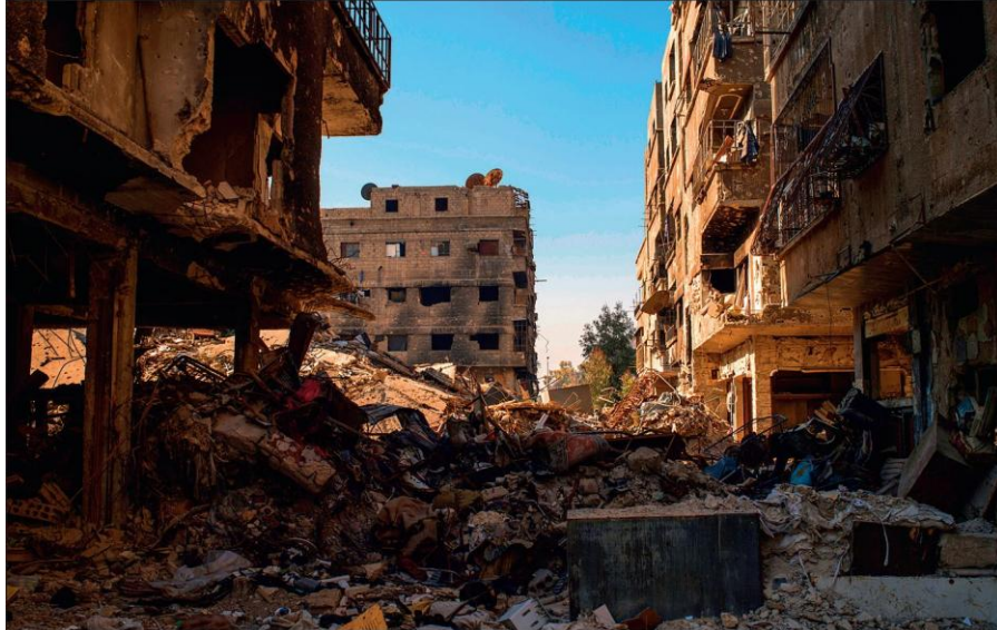
Разрушенный боевиками ИГИЛ Дамаск.

Эти материалы потом широко распространяются в социальных сетях и