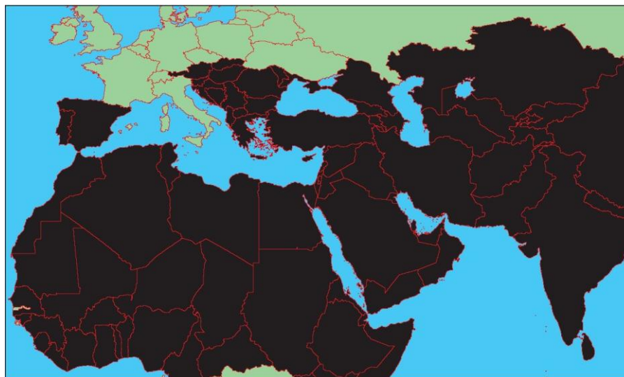
Карта мироустройства ИГИЛ

В настоящий момент группировка контролирует часть территории Сирии, а также ряд провинций в Ираке.