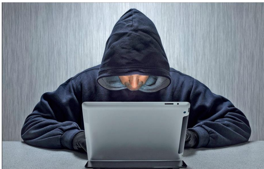
Вербовщики ИГИЛ активно используют Интернет.

Террористы день ото дня совершенствуют методы вербовки новых сторонников, а также алгоритмы их идеологической обработки. Читателю стоит помнить, что те типовые ситуации, которые описаны в данном пособии, можно рассматривать лишь в качестве базовых ориентиров,