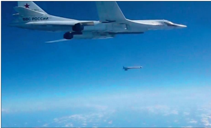
Воздушная операция российских ВКС по уничтожению боевиков ИГИЛ в Сирии.