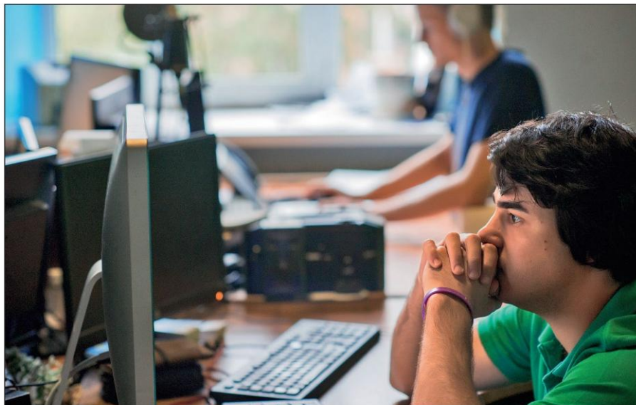
Постоянное присутствие вербовщиков ИГИЛ в соцсетях.

Через разнообразные «профили», «группы» и «чаты» в социальных сетях высококачественная мультимедийная продукция (видеоролики, саундтреки, электронные книги) распространяется по всему миру. Через эти же каналы активистами осуществляется и вербовка новых членов.