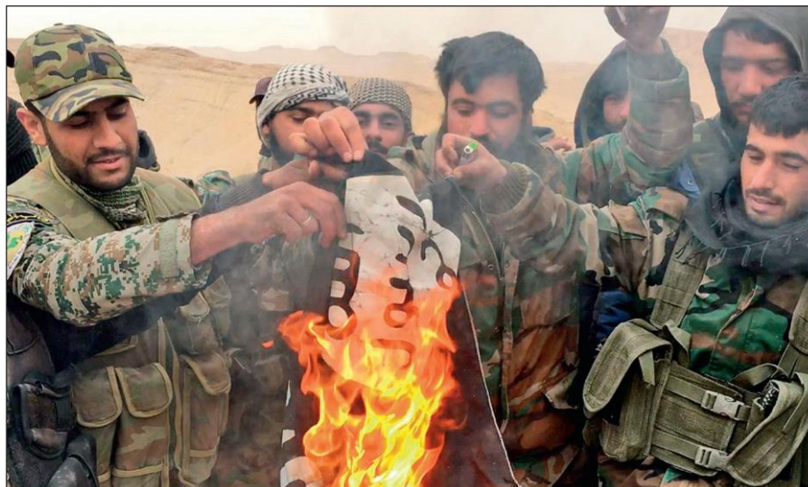
Народные ополченцы САР сжигают флаг ИГИЛ, снятый с отбитой у боевиков цитадели Пальмира.

Современное государство обязано защищать интересы каждого своего гражданина вне зависимости от его расы, национальности, принадлежности к определенной конфессии или религиозной традиции, в то время как ИГИЛ выражает интересы небольшой группы религиозных радикалов, жестоко подавляя остальную часть населения посредством запугивания, насилия и террора.