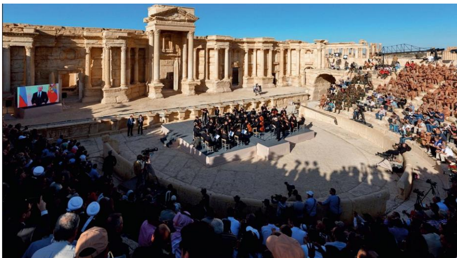
Освобожденная Пальмира. На концерте симфонического оркестра петербургского Мариинского театра под руководством народного артиста России Валерия Гергиева в Римском амфитеатре сирийской Пальмиры, освобожденной от террористов ИГИЛ.

Необходимо помнить, что «перепост» в Интернете любой пропагандистской продукции ИГИЛ может быть квалифицирован российским судом как распространение материалов экстремистской направленности, что влечет за собой административную, а в некоторых случаях и уголовную ответственность.