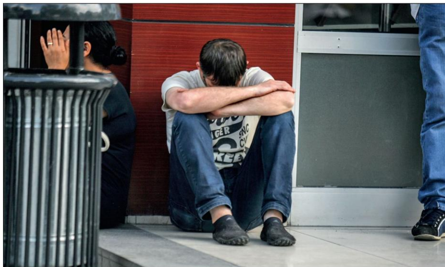
Наиболее уязвимы для вербовки одинокие люди, находящиеся в сложной жизненной ситуации.

Наиболее уязвимы для вербовки одинокие люди, недавно потерявшие своих близких либо имеющие серьезные жизненные проблемы. В группе риска люди, испытывающие обиду на общество или близких, чувствующие непонимание с их стороны, люди, находящиеся в духовном поиске либо подвергающиеся различного рода дискриминации.