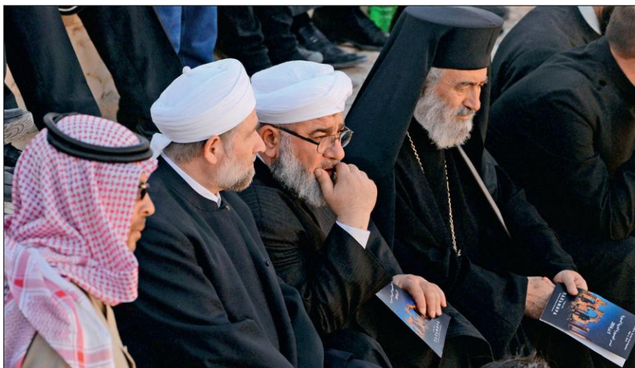
Представители различных конфессий объединились против ИГИЛ. На концерте симфонического оркестра петербургского Мариинского театра в Римском амфитеатре сирийской Пальмиры, освобожденной от террористов ИГИЛ.

В последнее время появилось значительное число верующих, причисляющих себя к крайним религиозным течениям (в СМИ упоминаются как «салафиты», «хариджиты», «ваххабиты»). Однако костяк ИГИЛ составляют лишь люди, причисляющие себя к ультрарадикальному крылу вышеназванных течений.